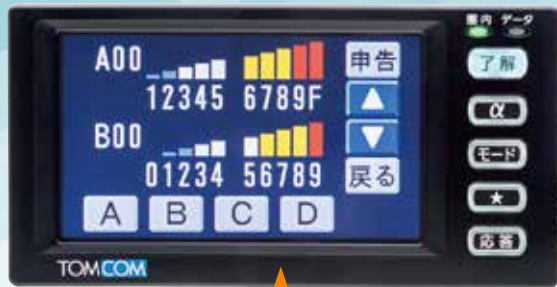
地区台数表示画面