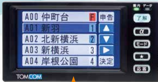
申告地区一覧画面