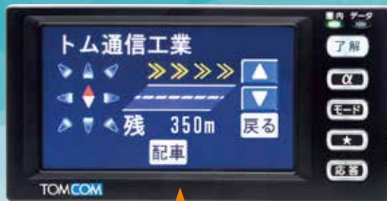
簡易方位ナビ表示画面