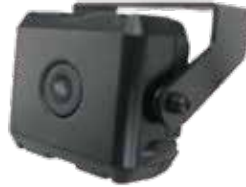
車内赤外線カメラ