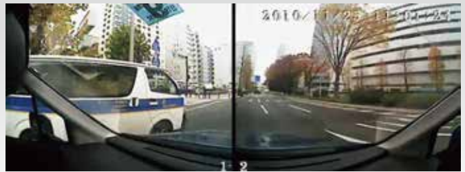
真横のクルマもこのように撮影