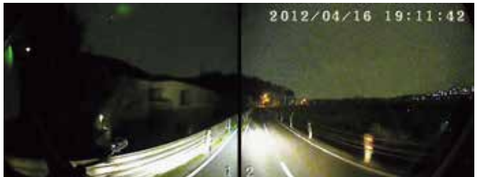
ヘッドランプの灯りだけでも撮影できます