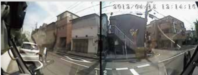
交差する道路も撮影

限りなく人間の視野に近い180°の撮影角度を確保するために、2個のカメラを内蔵しました。 真横からのトラブルに対しても確実に記録。 ※知的所有権 第254141号 取得