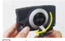
3 リングを時計方向へ回転