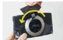
1 車から取り外した本機