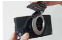
2 リングを本体から分離