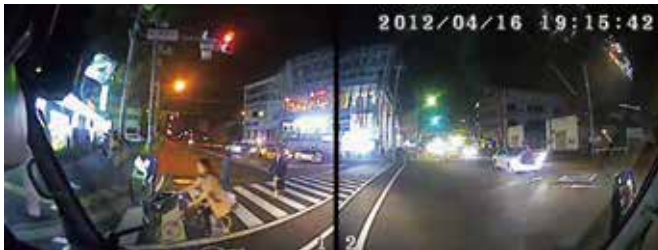
街中ではくっきり鮮明な映像

最低照度1.0ルクス。高感度センサーの採用で鮮明な夜間撮影が可能、しかも撮り漏れの少ない常時記録タイプ。