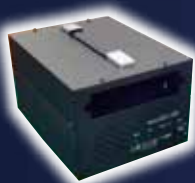
指令局用AC電源装置 TA-P500A