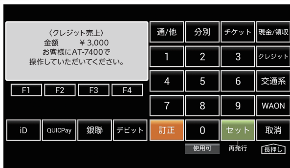
決済アプリ運用画面