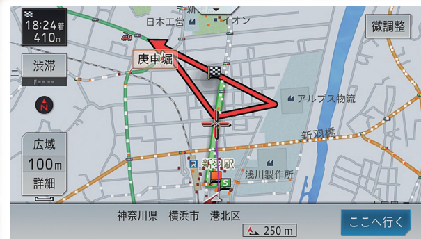
最適車両誘導画面「ホークアイ」