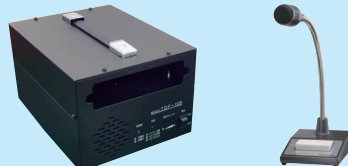
指令局用AC電源装置 TA-P500A スタンドマイク EA-M1017TEZ