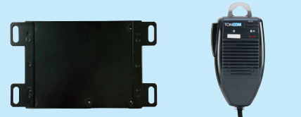
ナビ操作器 ET-8890TL スピーカーマイク EF-M10035TAZ