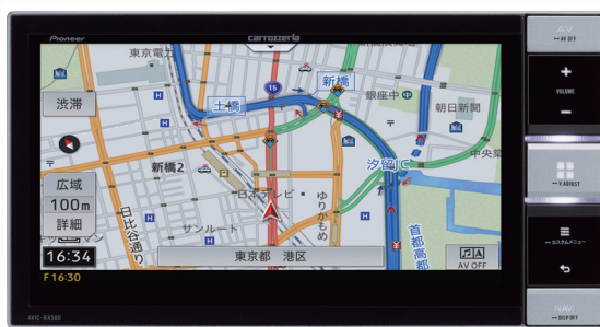
ナビゲーション画面